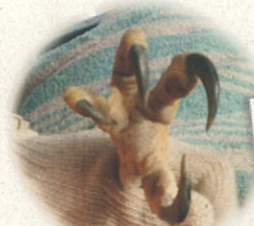
爪、足の裏のチェック

今回は大きい異常は見られませんが、少し嘴を整えました。他に擦れた跡があったので注意しながら毎日の観察を行う予定です。