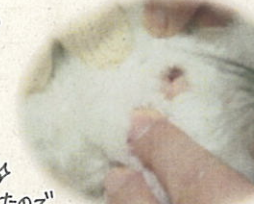
総排泄腔のチェック